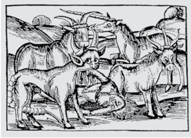
Abb. 3: Das Wesen links muss eine Manticora darstellen: Wenn auch die drei Zahnreihen anstatt hintereinander in drei Kiefern angebracht sind, so ist doch der Skorpionsschwanz recht naturgetreu wiedergegeben.

Im Unterschied zu den bisher zitierten Texten wuchs der Manticora nach Photius auch auf dem Kopf ein Stachel. Wurden daraus die Hörner, welche die Manticora später auf manchen Abbildungen trägt und damit entfernt an ein Rind erinnert?