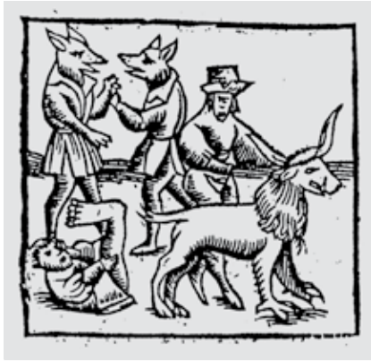
Abb. 6: Von links nach rechts: ein Skiapode, der sich mit seinem über-grossen Fuss Schatten spendet, zwei Cynocephalen im Gespräch, ein Hippopode (Pferdefüssler) sowie eine Manticora mit Hörnern und spitzem Schwanz

derung den Ausführungen über die Manticora beigegeben. Doch davon wird weiter unten noch die Rede sein.