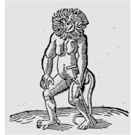
Abb. 8: Das seltsame thier , das gemäss Conrad Lycosthenes um 1240 von Jägern gefangen wurde.

Menschen und einen Kopf, der dem eines Hundes ähnlich sieht. 38 Interessantes Detail: Im Ortus Sanitatis wird der Cephus mit der sogenannten Centrocota identifiziert, die ihrerseits der Leucrocota oder Crocuta entspricht. Damit ist der Bogen zur Manticora wieder gespannt – die Sache beginnt sich im Kreis zu drehen!