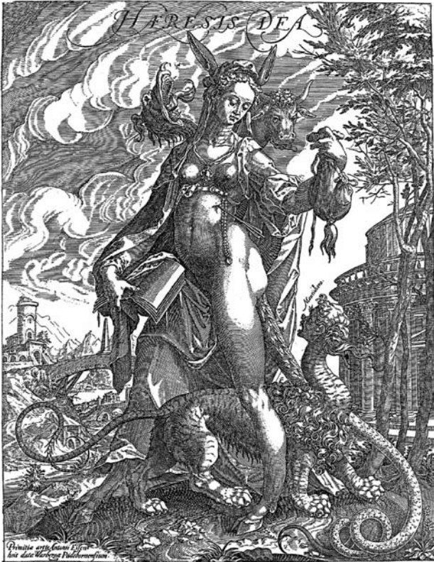
Abb. 11: Allegorie der Häresie in Begleitung einer Manticora. Holzschnitt von Anton Eisenhoit, Ende 16. Jahrhundert

Nachrede), welche beide als Töchter der Invidia (Neid) gedacht wurden. Mit dem Lemma Nemo domare potest (Niemand kann sie zähmen) könne die Manticora für die unbezähmbare Zunge des Verräters wie auch für den Neider stehen.