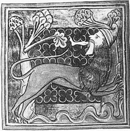
Abb. 1 und Abb. 2: Links eine Manticora mit der phrygischen Kappe, rechts eine Manticora mit stachelbewehrtem Schwanz