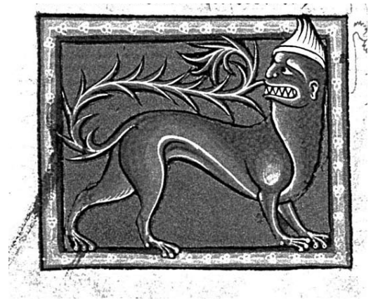
Abb. 7: Hyäne mit stacheligem Schwanz und übergrossen Zähnen beim Plündern eines Grabes

minis sunt, et oculi eius fuscus coloris. Cauda eius ut cauda scorpionis agrestis, et in cauda eius rubedo parva. Sonus oris eius velut audires loquentem hominem, et vox eius sicut vox tube. Velociter currit tanquam cervus et venatur homines et eos devorans manducat.