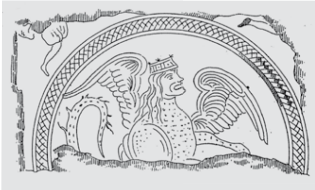
Abb. 4: Manticora mit Fügeln, gezeichnet nach dem Mosaikboden in St. Gereon, Köln.

Im Unterschied zu den oben zitierten Texten wird hier die Stimme der Manticora mit dem Zischen einer Schlange verglichen. Zudem erscheint erstmals der Vergleich mit einem Vogel bezüglich ihrer Geschwindigkeit im Laufen.