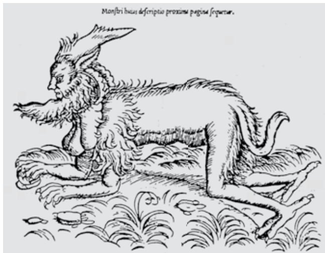
Abb. 9: Mostrum pilosum (haariges Ungeheuer) aus Conrad Gessners De Quadrupedibus (Über die Vierfüßler) von 1551.

In der Beschreibung durch Conrad Gessner erscheinen zwar die Züge der Manticora, doch war er, möglicherweise aufgrund eines ähnlichen Holzschnitts wie in Lycosthenes' Buch, der Meinung, dass es sich hier um einen Affen oder um einen Satyr handelte. Denn derselbe Holzschnitt illustriert in dessen Wunderwerck Gottes neben dem hier besprochenen Wesen eine Art Waldmenschen, der als Stro-