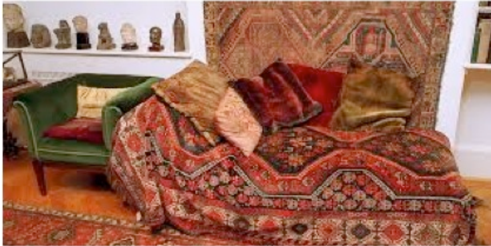
Freuds Behandlungscouch (Freud-Museum Wien)

Was ist los mit mir? — Wie kann ich wieder Fuß fassen in der Welt?